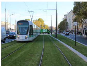
Des maréchaux verdis.

➔ Végétalisés, embellis, ouverts à tous, les « maréchaux » sont transformés. Et au milieu circule un tramway.