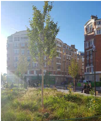
Un espace de convivialité.