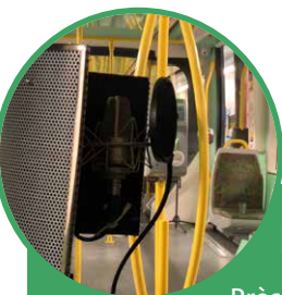
Le T3 transformé en studio.