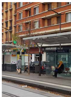
Des stations accessibles à tous.