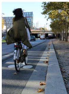
Des pistes en continue et sécurisées le long du tram