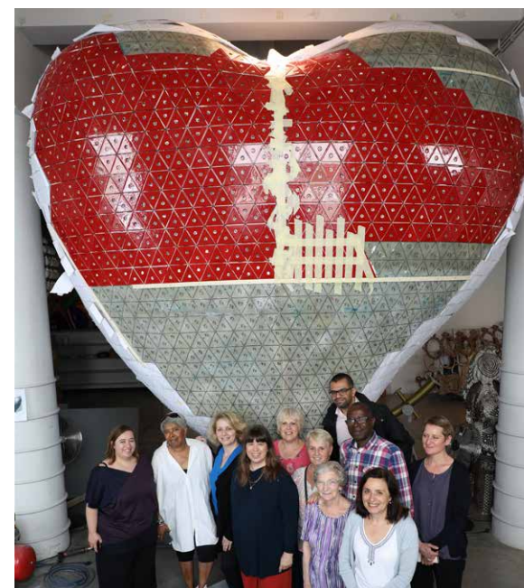
«Cœur de Paris», Joana Vasconcelos et son équipe.

Le « Cœur de Paris », installé porte de Clignancourt par Joana Vasconcelos est très fidèle au projet initial développé en collaboration avec des commanditaires représentant les riverains et associations du quartier. Ces derniers ont eu le privilège d'une visite éclair à l'atelier lisboète pour apprécier l'avancement de la fabrication du cœur, lequel sollicite le savoir-faire séculaire des artisans portugais qui fabriquent ces azulejos sur mesure. Quand il sera hissé sur son mât de 11 mètres de haut, le Cœur de Paris constituera la première œuvre installée durablement sur l'espace public français par cette artiste européenne majeure.