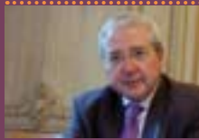
Jean-Paul Huchon, Président de la Région Île-de-France Président du STIF