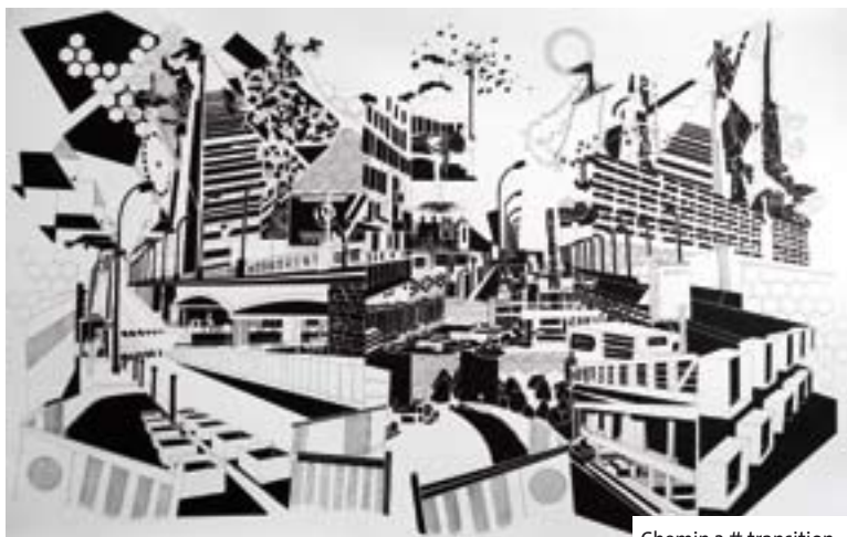
Chemin 2 # transition

Tout au long du chantier du T3, quatre artistes vont poser leur regard sur les quartiers de l'est parisien en pleine transformation. Leurs œuvres seront exposées en mairies d'arrondissement, au Pavillon de l'Arsenal, au Carré Baudoin... Nous vous présentons dans ce numéro l'un de ces artistes, Chourouk Hriech.